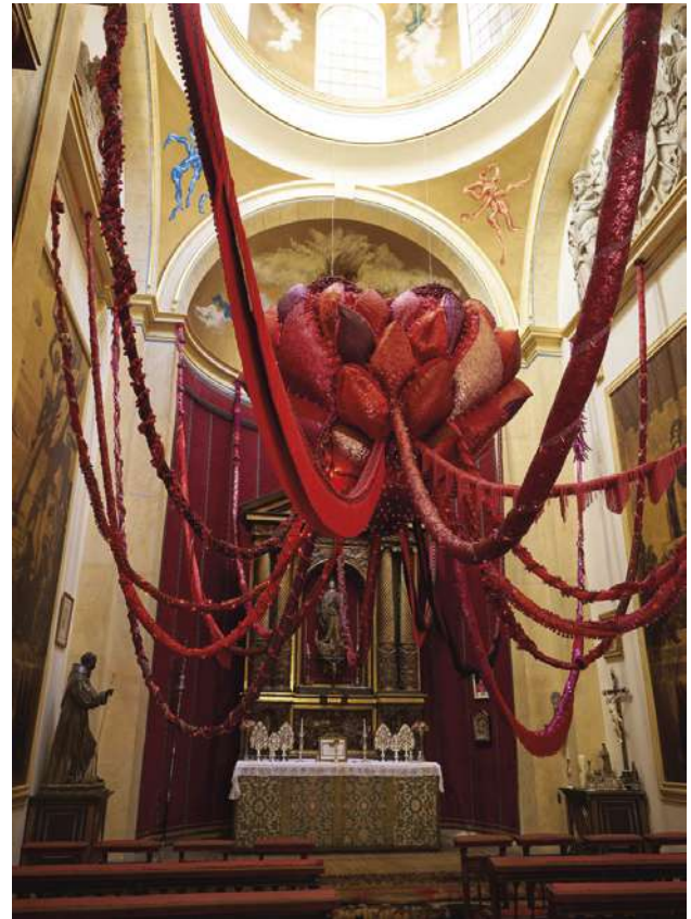
Vista de la exposición.

Ahora le toca el turno al Palacio de Liria, en Madrid, un espacio que abre un nuevo diálogo entre el pasado y el presente,