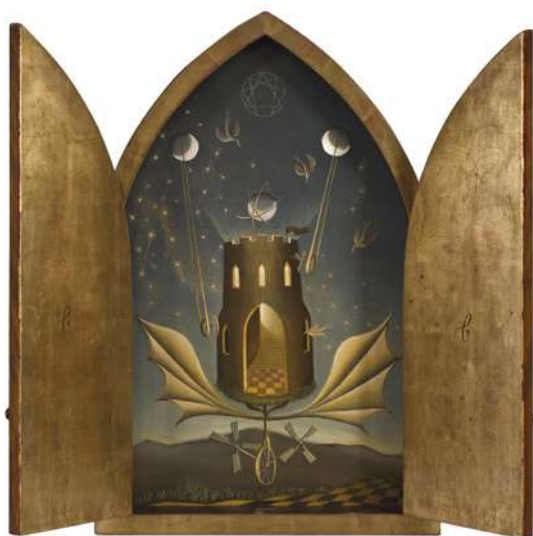
Remedios Varo Icono, 1945 Óleo, incrustaciones de nácar y pan de oro sobre madera Cerrado: 60 × 38,2 × 35 cm / abierto: 60 × 70 × 35 cm Colección MALBA. Museo de Arte Latinoamericano de Buenos Aires N.º INV.: 1997.02 © Remedios Varo; VEGAP, Madrid, 2025.