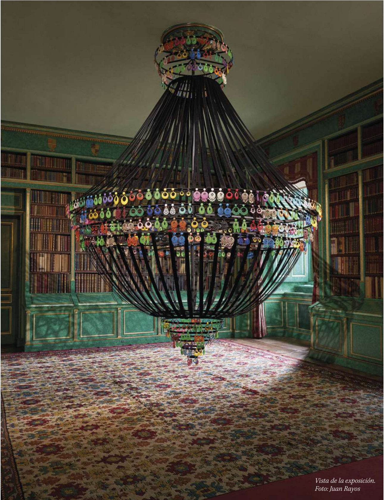
Vista de la exposición.