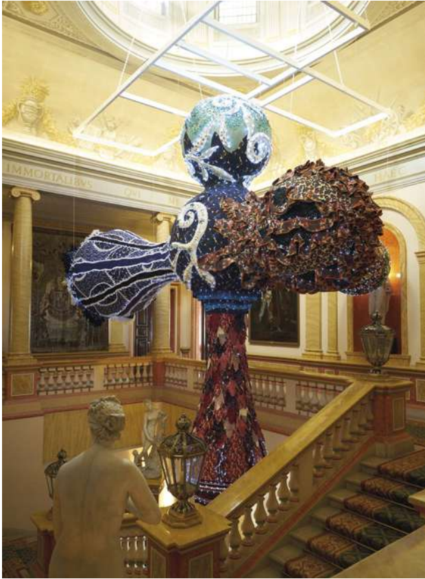
Vista de la exposición.

entre grandes maestros como Goya y Velázquez y nuevas visiones contemporáneas como la de Vasconcelos.