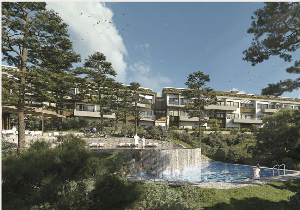
LA MORALEJA | MADRID