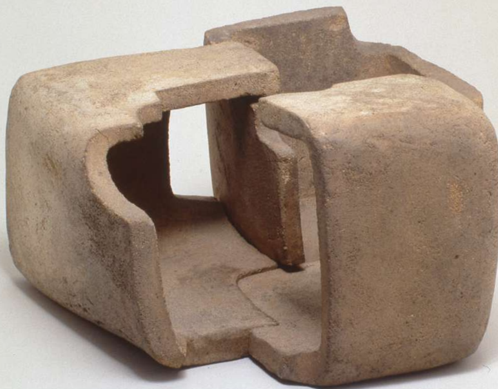
Eduardo Chillida. La casa del poeta III. 1981. Tierra chamota. Chillida Leku.