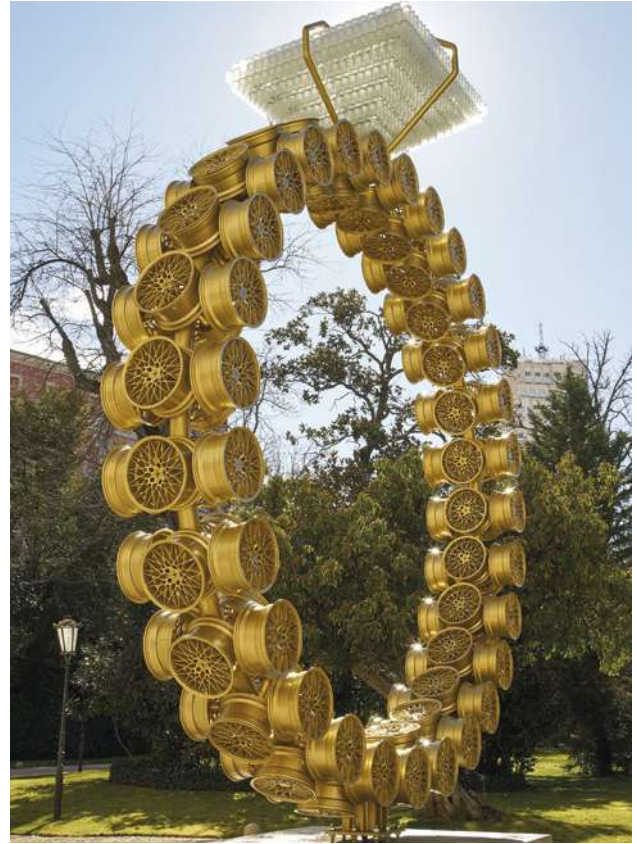
Vista de la exposición.